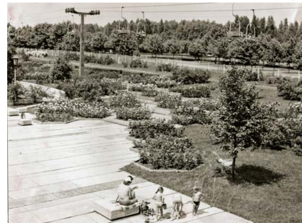
Parkowy ogród różany ma już pół wieku