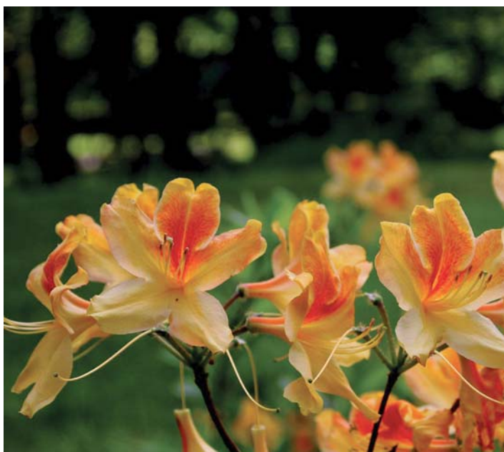
Zakwitły azalie przy Ogrodzie Japońskim. To kwiaty późnowiosenne, możecie je jeszcze znaleźć m.in. przy siedzibie Fundacji Park Śląski, poniżej Dużego Kręgu Tanecznego, w Ogrodzie Bylinowym i przy stawie, obok restauracji Łania

Teraz czekamy na róże, które powoli zaczynają kwitnąć. W czerwcu serdecznie zapraszamy na spacer do naszego Rosarium. Do tego czasu zostaje nam podziwianie na fotografiach tych roślin, które wiosną 2018 roku upiększały Park Śląski. ■