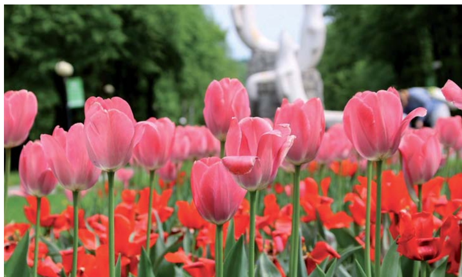
Tak urosły tulipany przy alei Żyrafy. Park otrzymał je w zeszłym roku od Carrefour Polska w formie darowizny. Prezentują się naprawdę okazale