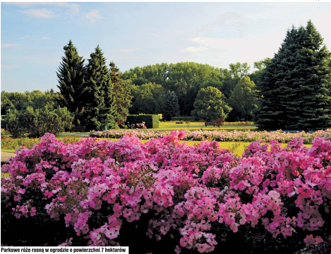
Parkowe róże rosną w ogrodzie o powierzchni 7 hektarów