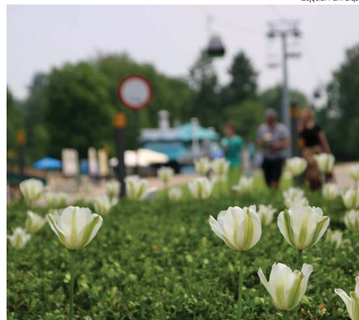
Białe tulipany i bukszpan stworzyły parkowe logo. Świetnie widać je z kolejki linowej. Od kilku lat kwietnik przy fontannie Pelikany budzi powszechną sympatię